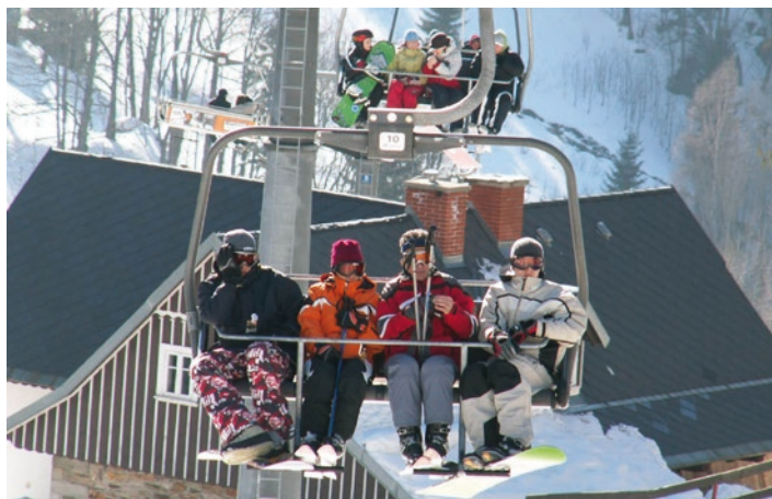
Skipasy rozdělěná Rokytnice nad Jizerou

Dálnice sjezdovek v krkonošské Rokytnici nad Jizerou po skoro dvou desetiletích rozparcelovaly skipasy. Jízdenka donedávna v lyžařské aréně platná pro všechna přepravní zařízení koncem loňské sezóny skončila.