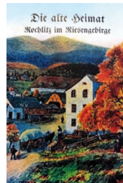
Originál knihy v německém jazyce